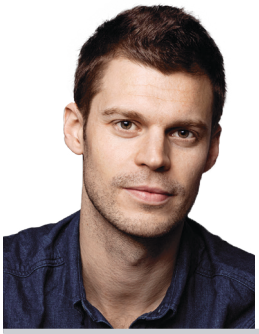
Bjørnar Moxnes b.moxnes@roedt.no Leder i Rødt