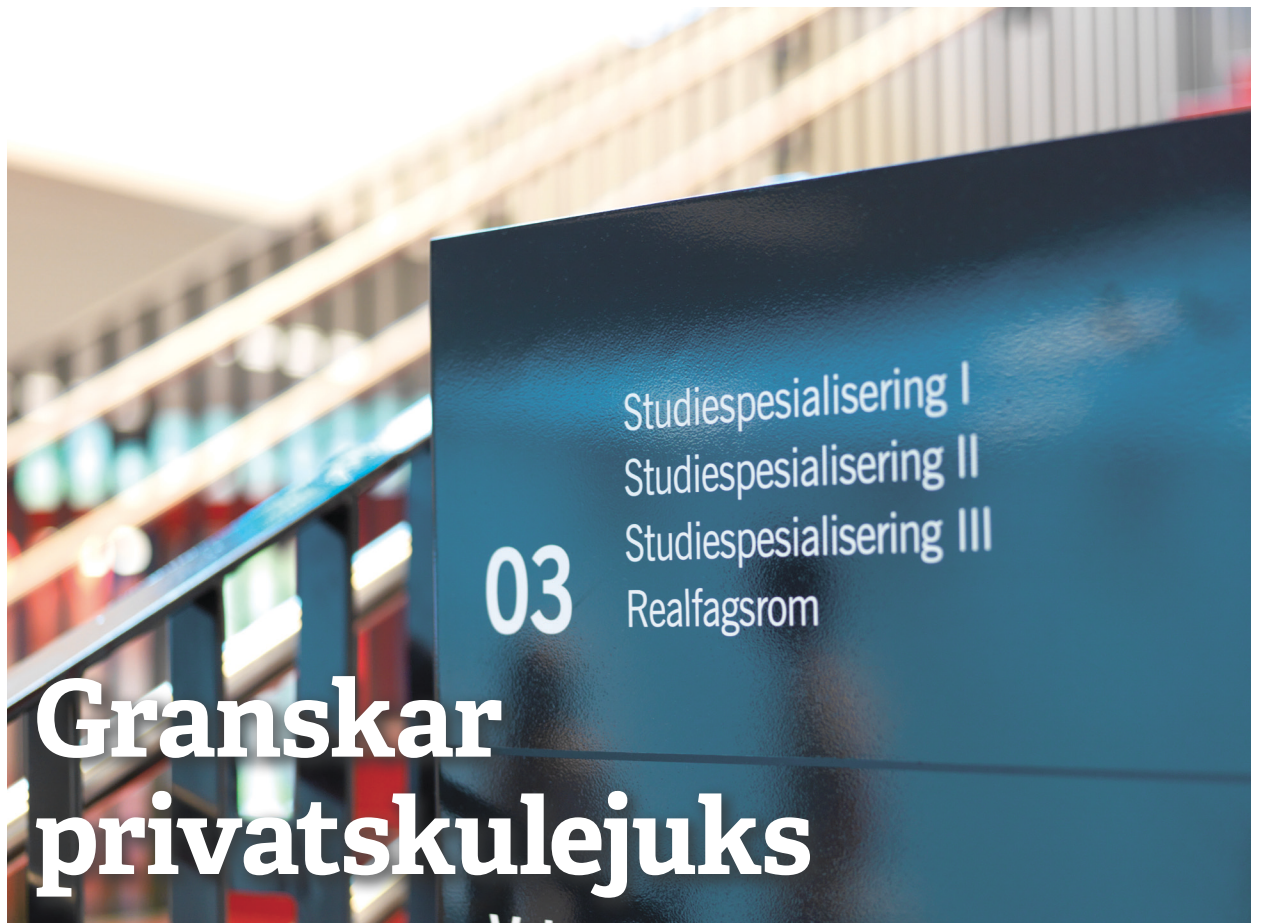
Konkurranse: I Hordaland fortrenger dei private skulane dei offentlege.

Arbeidslivet utgjør selve grunnsteinen for resten av livet. Om kvinner presses hardere i arbeidslivet og lønna deres går ned vil det også påvirke ansvarsfordelingen på hjemmebane. Dersom kvinner tjener enda mindre og lønnsforskjellene mellom menn øker, vil incentivene til at mor tar hovedansvaret hjemme øke mens far tar mer av forsørgerrollen. Faktorer som et organisert arbeidsliv og en sterk velferdsstat har vært avgjørende i den norske likestillingsmodellen. Men globalisering, liberalisering, privatisering og svekkelse av vår velferdsmodell utgjør en trussel mot den norske likestillingsmodellen.