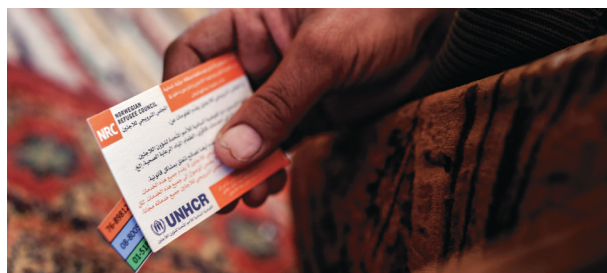
Strengt: Norge har Europas strengeste asylpolitikk.