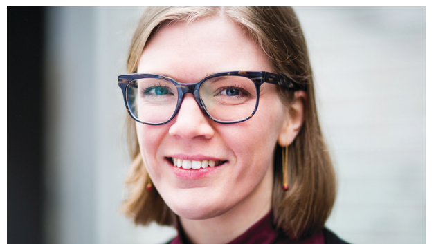
Nestleder i Rødt: Marie Sneve Martinussen.

Rødt-nestlederen mener også at pengebruken til forsvaret gir grunn til bekymring. Hun tror