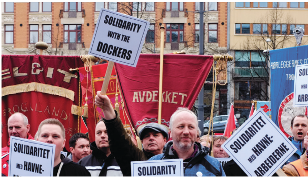
Vant viktig seier: Havnearbeiderne i Drammen.