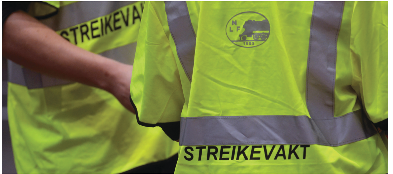
I streik: Norsk Lokomotivmannsforbund.